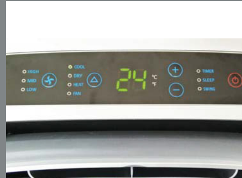
Digitalpanell mit LED Display