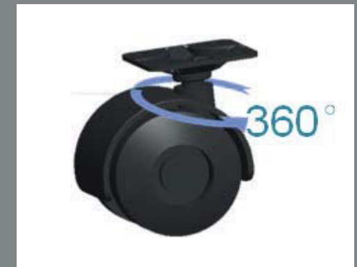
360° schwenkbare Rollen