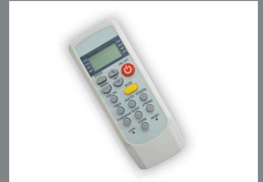
Fernbedienung mit LCD Display