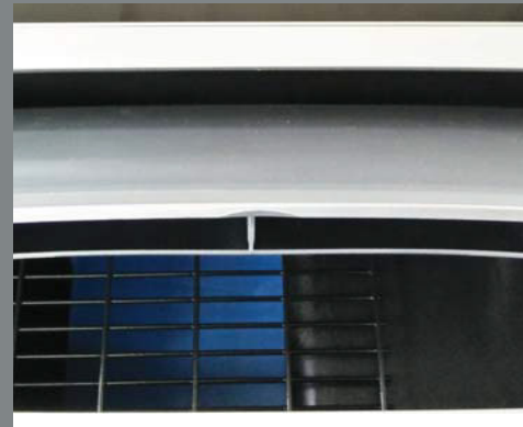
Automatische Öffnungsfunktion der Lamellen